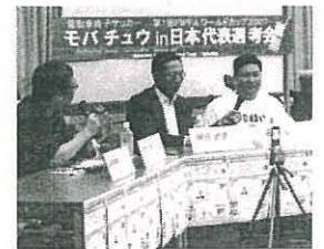
元代表監督の岡田武史氏が参加したワールドカップ・トークをモバチュウ