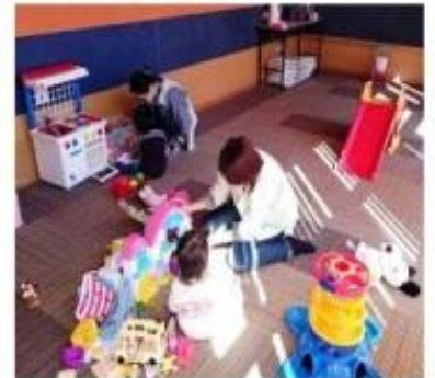
「ママのリフレッシュ託児」での様子